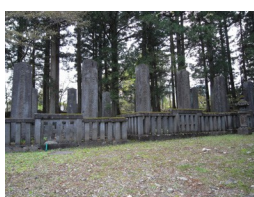
⑤殉死の墓 三代將軍家光死去に際し 殉死された側近の墓