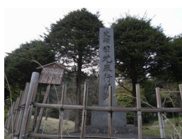
①日光奉行所跡 集合・出発 日光千姫物語前 AM6:25分