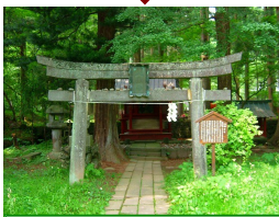
⑥八幡神社 八幡神社は日光開山の祖 「勝道上人」が作りました。 (勝負の神)