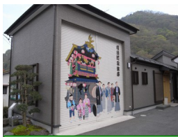
⑧家体庫 二荒山神社の弥生祭で使 用される花家体の収納庫