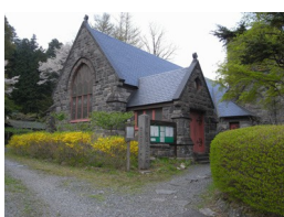
②日光真光教会 石造りの大正時代の教会