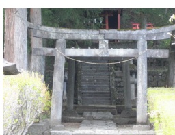
③青龍神社 弘仁11(820)年、 弘法大師の開基と伝えら れる (気象の神)