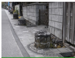
⑦石造りの簡易水道 自然石で造った珍しい石 升の簡易水道がある。水 源は近くの湧水で、今は 飲用されていない。