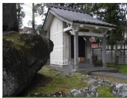
⑨磐裂神社 町内の氏神様として崇敬 されている神社で、磐裂 の神と根裂の神を祀って いる (心身健全の神)