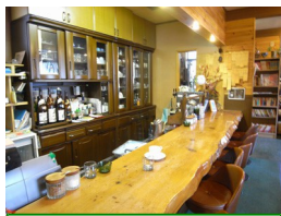
⑩喫茶ベル AM7:30頃着 美味しいコーヒーをお召し 上がりいただいた後、解散